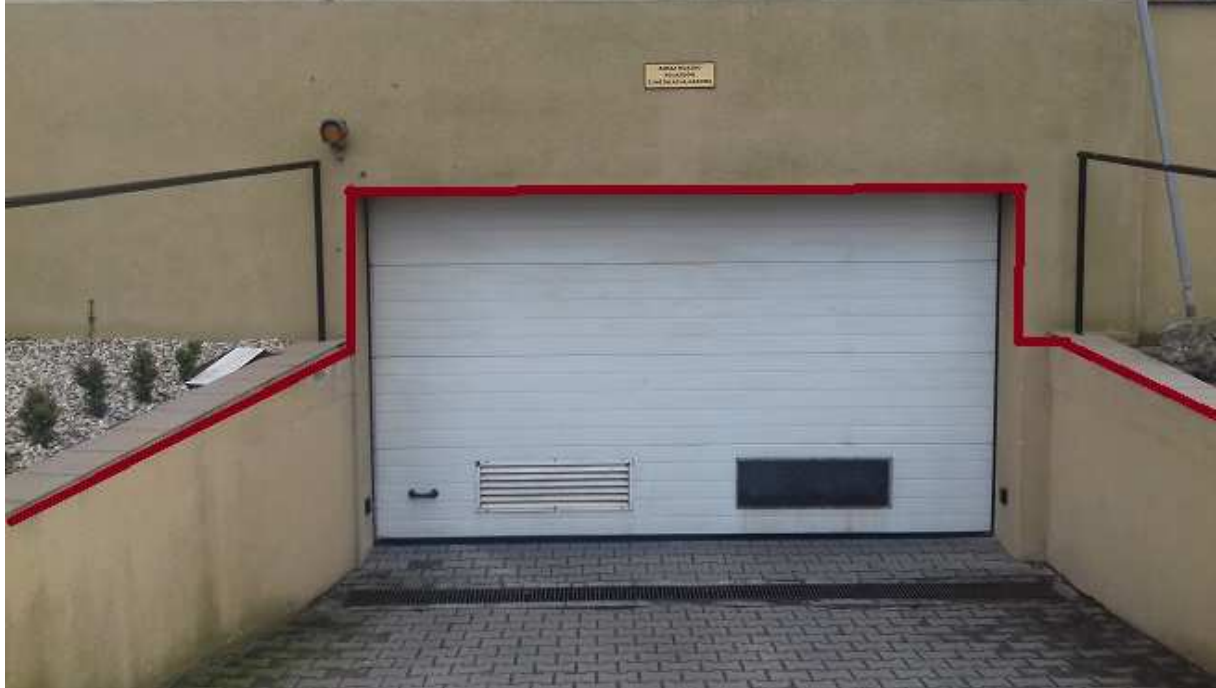
zdjęcie nr 4